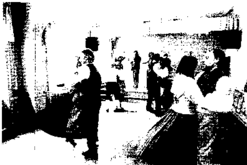
danskompisar 27 apríl 2008