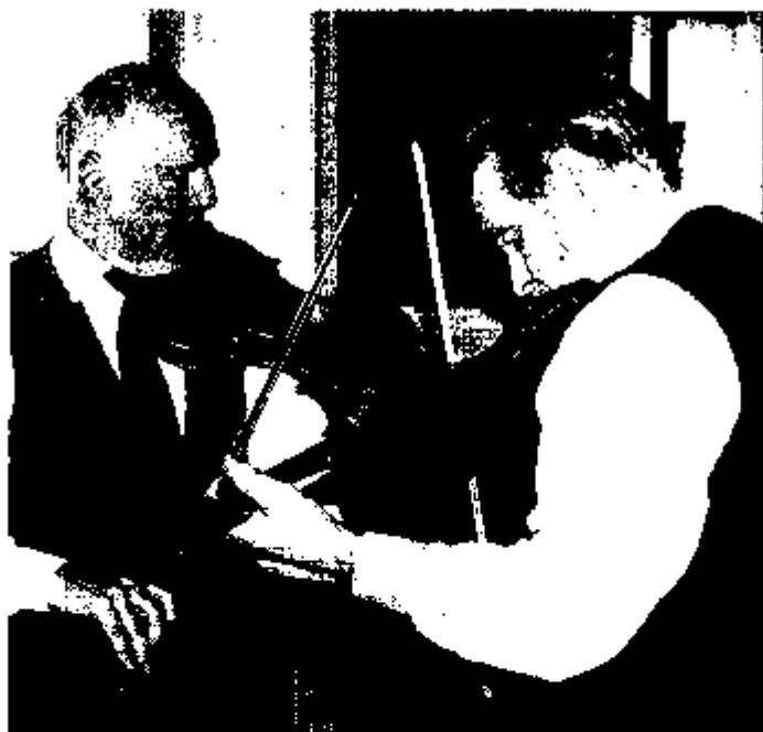
spelkompisar 27 apríl 2008