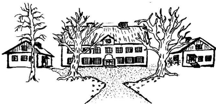
Jakobsbergs gård