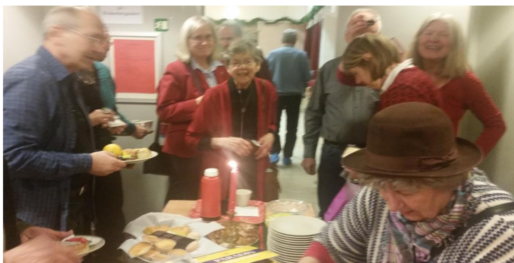
Bild : Julavslutning sista onsdagen i december 2016