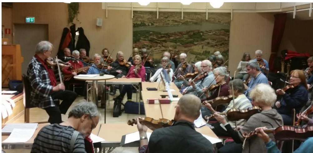
Bild : Gillet övar i nya lokalen i Tellus Fritidscenter. Lignagatan 8 nära Hornstull