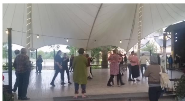
Bild: Stort fint dansgolv under segeldukstak på Hågelby

hade utlokaliserat sig på prov, eftersom dom inte hyr Skeppsholmsgården under sommar-månaderna. Arrangemanget heter "Skeppis på rymmen". Jag ledde allspelet och Gillet spelade ett pass med blandad dansmusik.