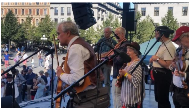
Bild : Stockholms Spelmansgille, Stora scenen