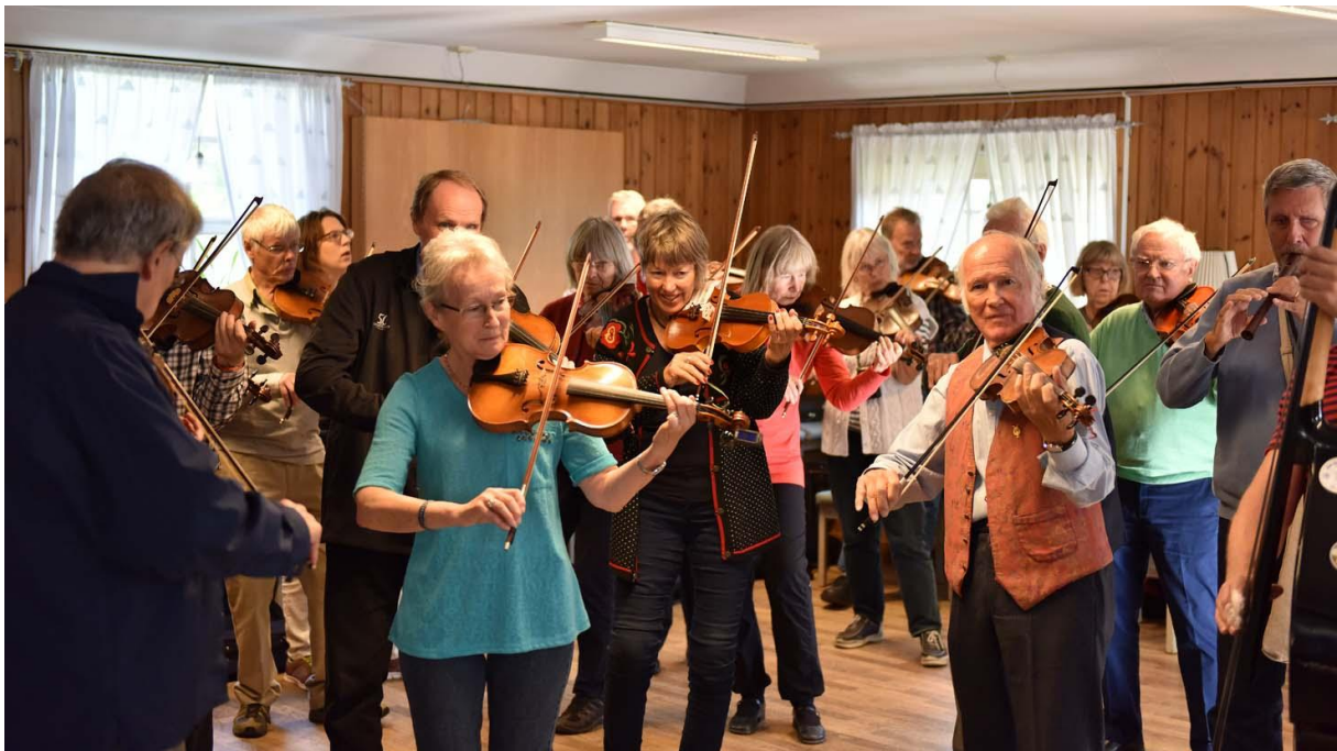
Allspel 28/9.

27 april – Gillet spelar på samkväm i Kungsholmens församling.