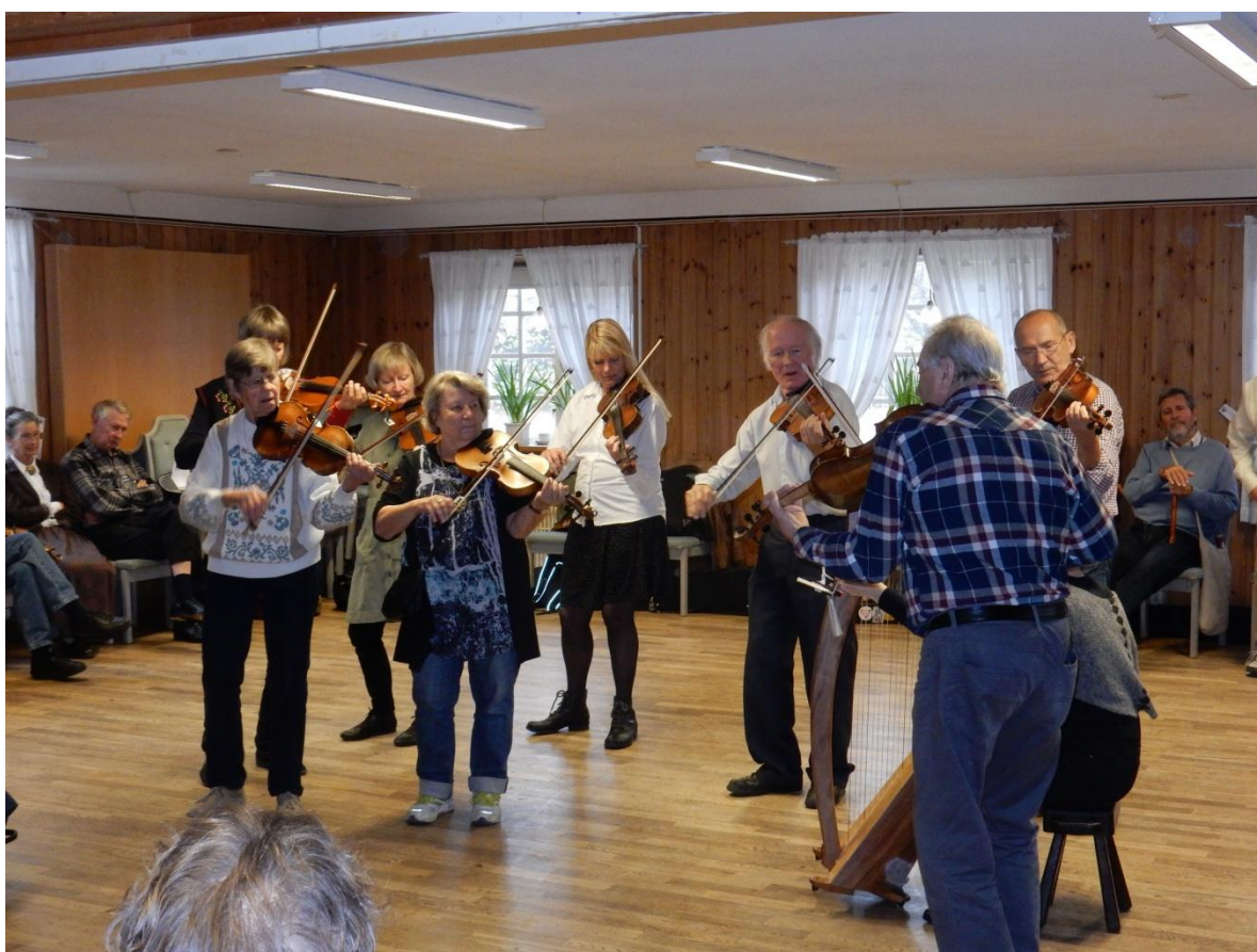
Några SSG:are och SUG:are.