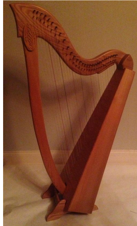
Andra harpan: 120cm, 29 strängar, Alm, björk och gran