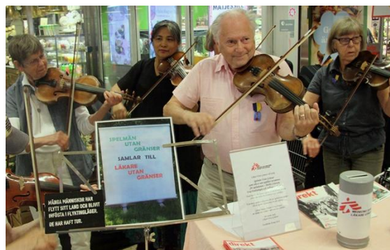
Spelmän utan gränser under insamling.

Men så flög det i mig att jag skulle entusiasmera några spelkompisar att spela in pengar – lite mer systematiskt, men ändå sporadiskt – till LUG.