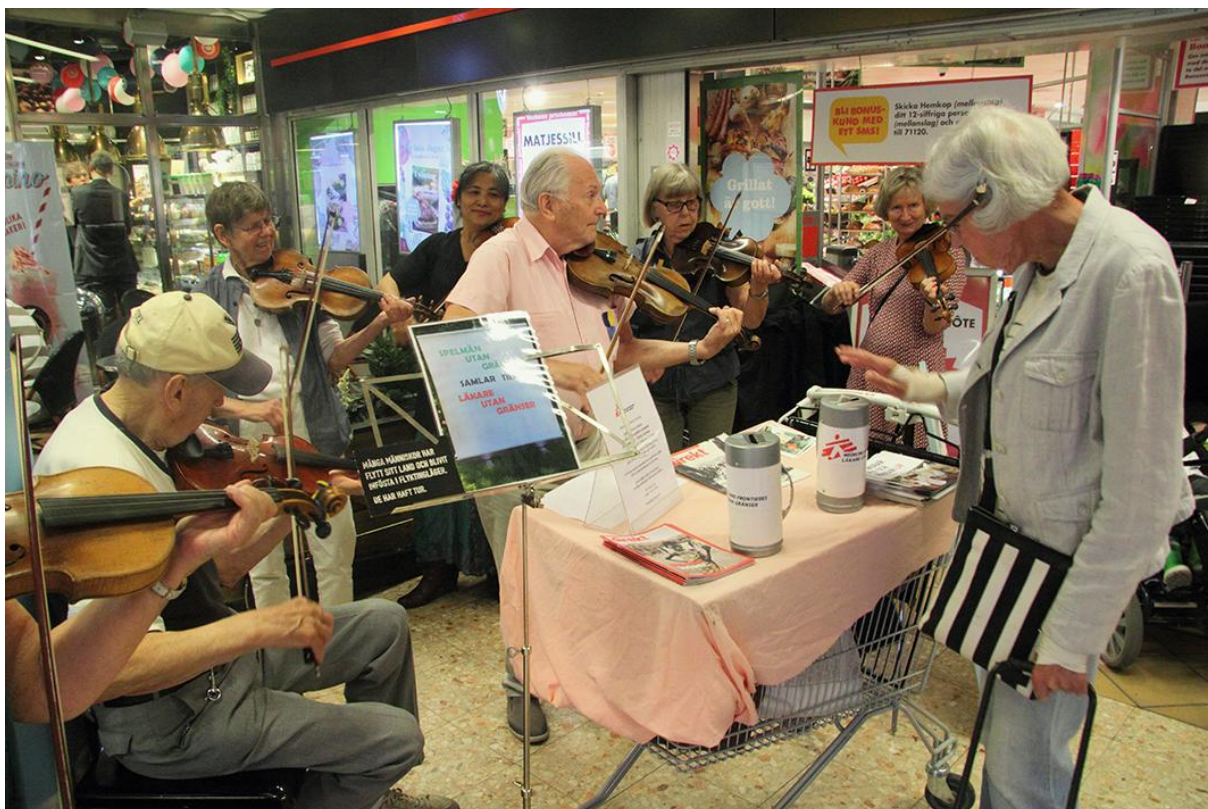
Spelmän Utan Gränser samlar in pengar till Läkare Utan Gränser.