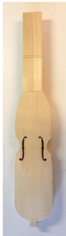
...och snart tredje nyckelharpan