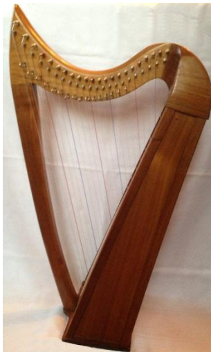
Första harpan: 70cm och 22 strängar, Valnöt och plywood

Men när man väl blivit biten går det inte att sluta instrumentsnickra – nästa ansats blev med en ritning på en lite större harpa och virke som jag fick från några snälla grannar. Almen hade kapats i tro att den hade almsjuka, men visade sig vara fullt frisk så en del kunde omvandlas till en harpa. Resonanslådan var återigen lådformad, med en lock av finvuxen gran från stockarna i en hundraårig ladugård - som ger en mycket bra ljudkvalité. Tyvärr innebär den djupa halsformen att virket spricker - så det är snart dags för andra reparationsomgången. En harpa har beskrivits av en klok byggare som "en konstruktion för att bryta isär trä" – inte helt orimligt med tanke på att det blir en kraftig snedbelastning då alla strängar kommer från samma sida av halsen – och sprickor är tyvärr en vanlig konsekvens.