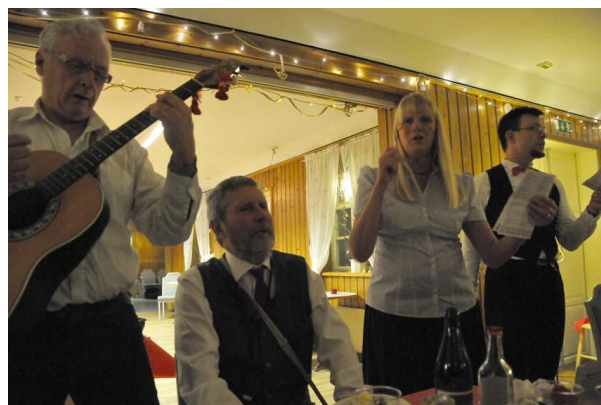
Festkommittén leder allsången.