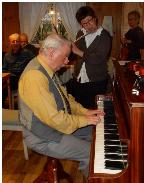
Nalle på piano och Lotten på tvärflöjt spelar musik av Evert Taube.

"Nalle" och Lotten avslutade konsertprogrammet och spelade några välkända melodier på piano, bl.a. Fritiof i Arkadien.