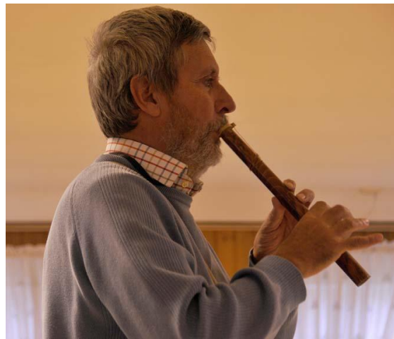
Artikelförfattaren med cylindrisk spelpipa.

närliggande tonarter. Men de är ganska begränsade i detta avseende.