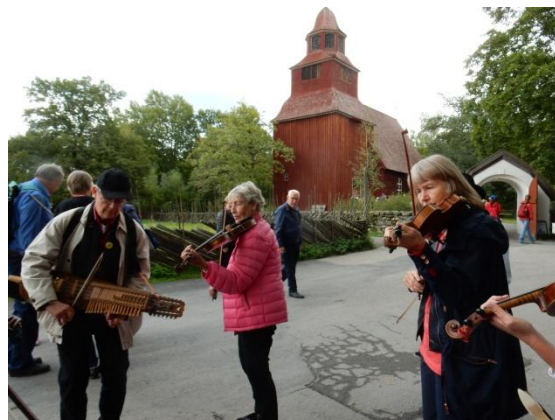
Uppvärmning framför Seglora kyrka inför dansspelning på Bollnästorget.

spel på scen. Ett drygt tiotal spelmän från Onsdagsgruppen på fiol, gitarr och nyckelharpa medverkade under ledning av Allan Westin.