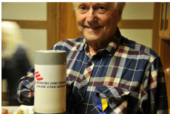
Artikelförfattaren med insamlingsbössa.

-I så fall kommer jag att sätta in beloppet oavkortat på Läkare Utan Gränser (LUG:s) konto. Vi fick hela 5000 kronor! Det kändes skönt att få sätta in pengarna till LUG!