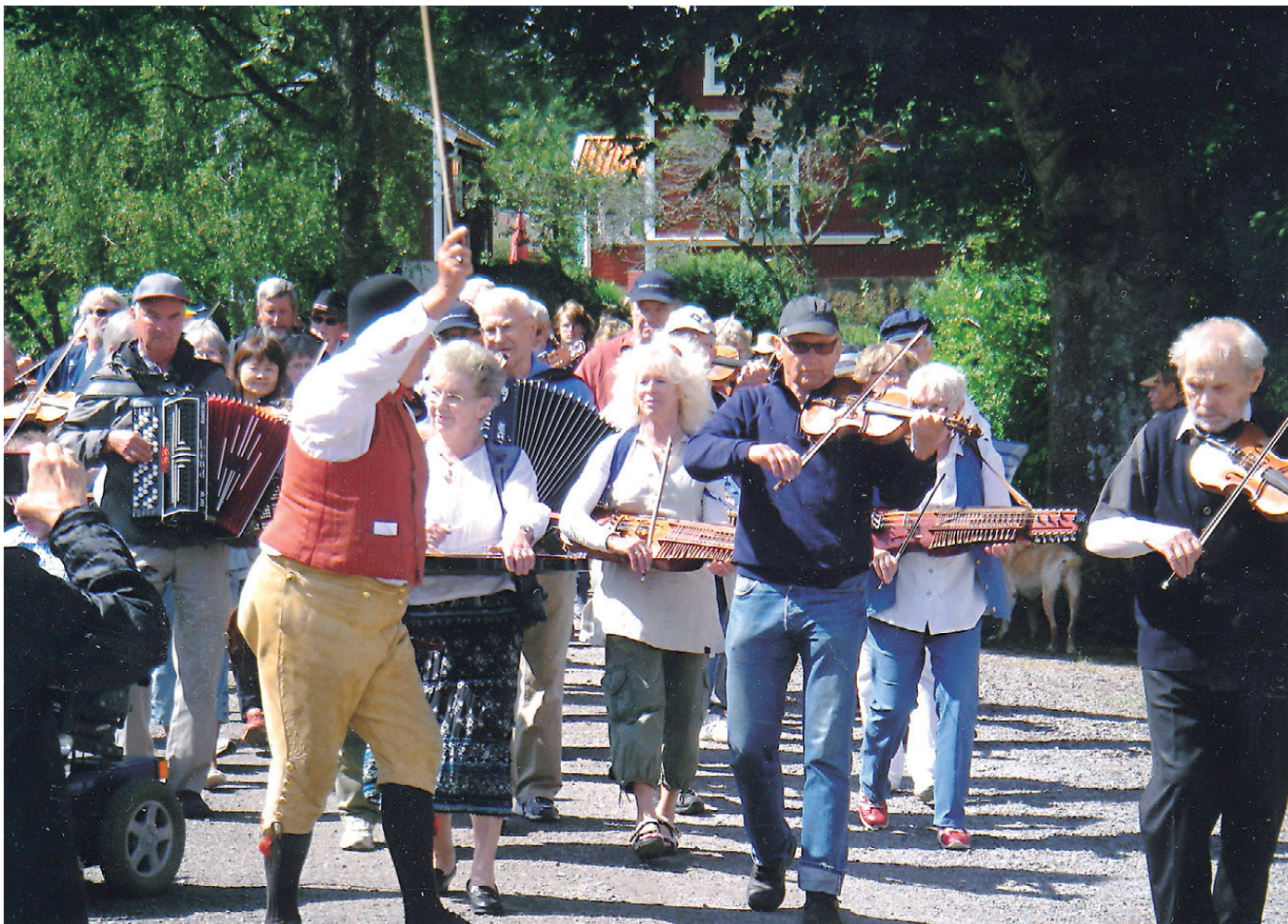
Det var en stor skara spelmän som vandrade nerför bruksplan i Wira bruk. ÅKERSBERGA KANALEN