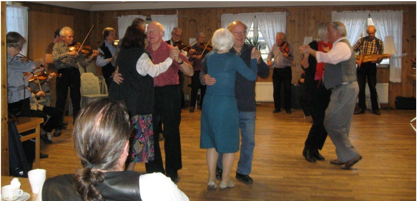
Dans till allspel