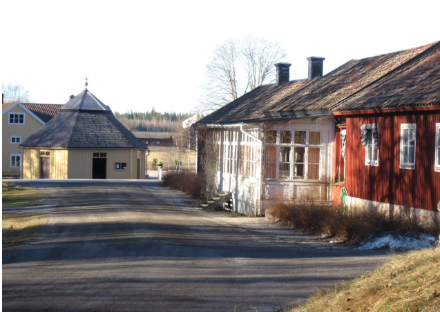
Sätra Brunn med den anrika brunnen med sitt mineralrika vatten