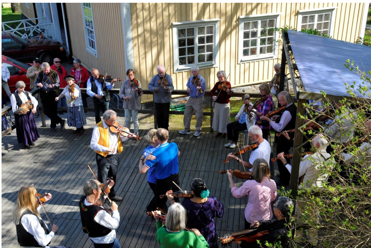
Utomhusspel till dans på Jakobsbergs gård 27 april.