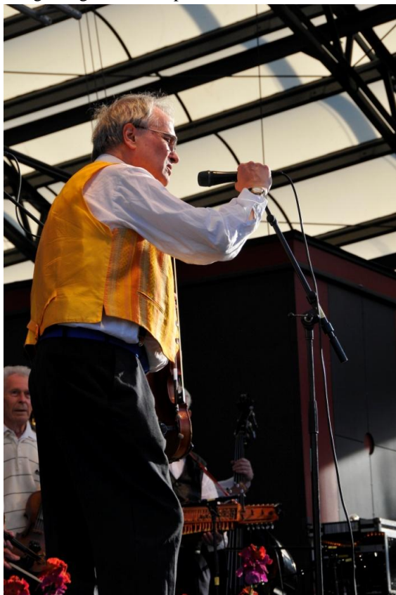
Kungsträdgårdens scen. Allan presenterade låtarna,

27 april. Dansens dag i Kungsträdgården. Direkt efter söndagens spelträff i Bredäng for Gillet in till Kungsträdgården och spelade till dans.