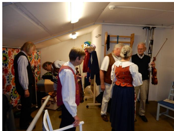
Långbroberg. Förberedelse inför scenspel.

19 juni. Scenspel på Långbrobergs äldreboende.