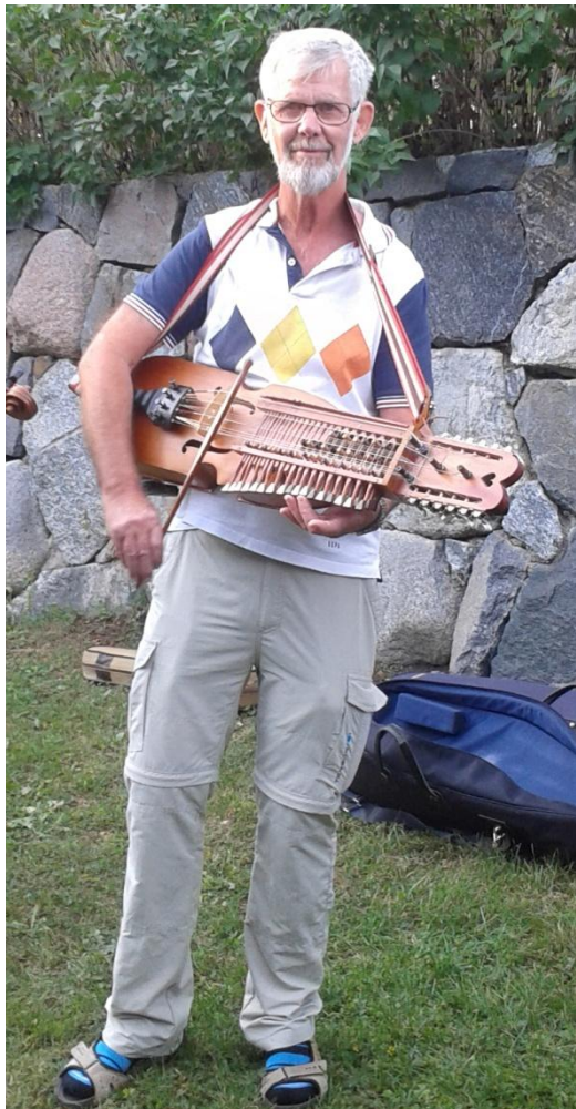
Buskspel på Hesselbystämman.