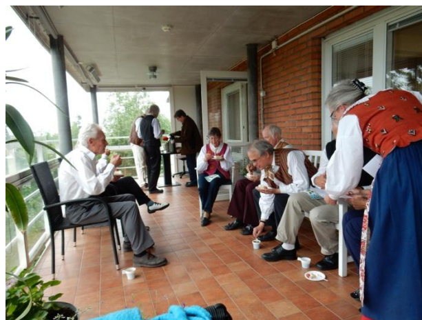
Långbroberg. Efter framträdandet bjöd personalen på kaffe och tårta.

7 augusti. På Hesselby Folkmusikfestivals första dag buskspelade Gillet till allmän förtöjelse. Några tappra par dansade till vår musik på grusgången intill.