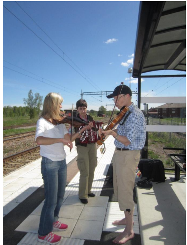
Deltagarnas jam på tågstationen.

Förutom spelkursen med Per Gudmundsson, hann vi också med att spela med varandra. För mig kändes det som att vi hann med mycket men det var inte bara "låtmatning" utan allt fick plats. Och framför allt fick vi höra Per Gudmundsson spela, det var nog höjdpunkten för många av oss.