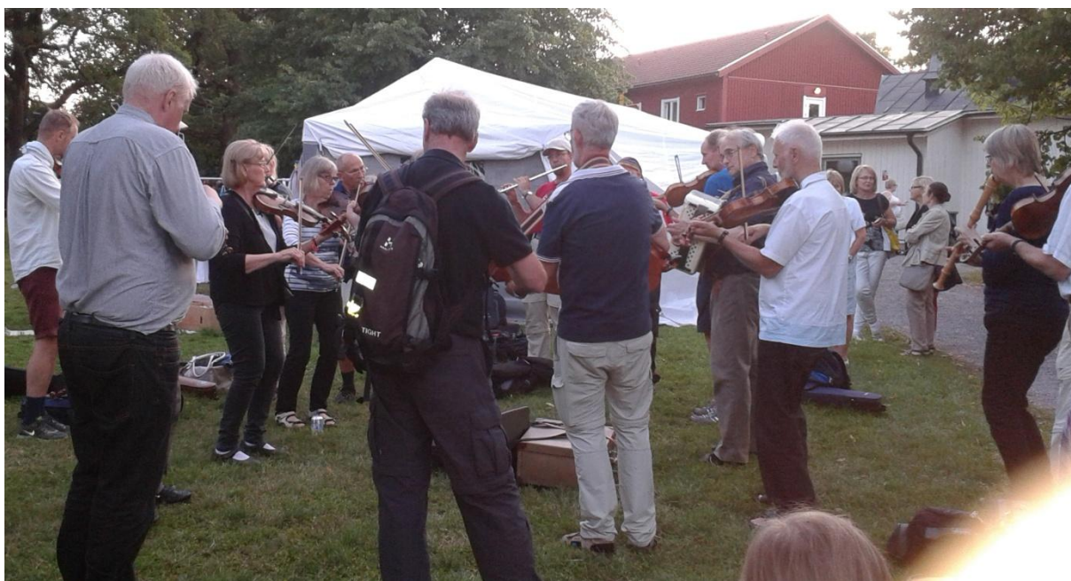
7 augusti Hässelby: Gillet buskspelade innanför festivalområdet.