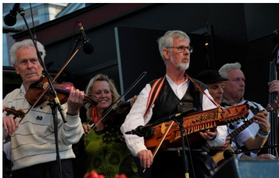
... varpå Gillet framförde dem.

18 juni. Riddarsporrens seniorboende, scenspel på innergården.