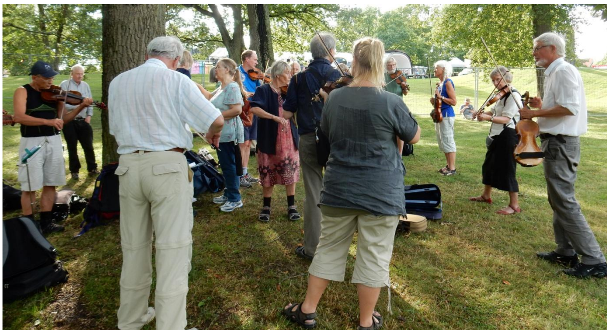
7 augusti Hässelby: Gillet buskspelade utanför festivalområdet.